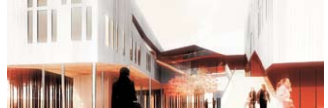
Atelier Philéas - Mairie de Bry

Lisätietoa saat numerosta (09) 741 9700 /myynti.