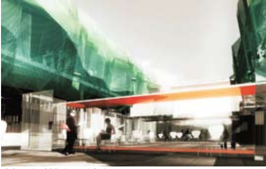
P. Roussel - Bibliotheque à Paris